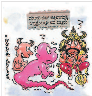
ದುಬಾರಿ ಬಿಲ್ ಕಟ್ಟಲಾಗದೇ ಬಂದವನು ಇವನು. ಆಸ್ಪತ್ರೆಯವು ವಸೂಲಿ ಮಾಡಲು ಇಲ್ಲಿಗೂ ಬಂದ್ರಾ ಎಂದು ಭಯಗೊಂಡಿದ್ದಾನೆ ಮಹಾಪ್ರಭು!