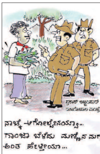
ನಾಚ್ಕೆ ಆಗೋಲ್ಲೆನಯ್ಯಾ... ಗಾಂಜಾ ಬೆಳೆಸು ಮೂಲೈನ ಮಗು ಅಂತ ಹೇಳೋಯ್ಯಾ...