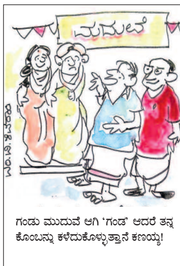
ಗಂಡು ಮುದುವೆ ಆಗಿ 'ಗಂಡ' ಆದರೆ ತನ್ನ ಕೊಂಬನ್ನು ಕಳೆದುಕೊಳ್ಳುತ್ತಾನೆ ಕಣಯ್ಯ!