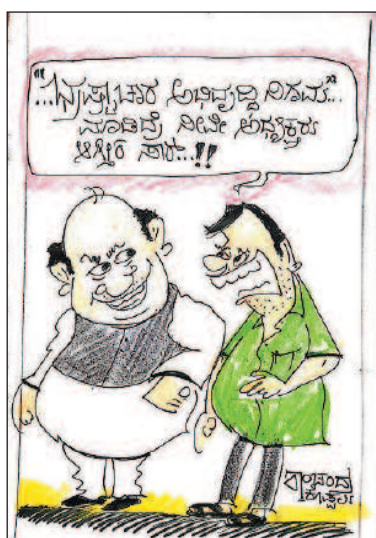
ನಿನ್ನನ್ನು ಕೂಡಿಸಿ ನಿನ್ನನ್ನು ಸೂಚಿಸಿ ನಿನ್ನನ್ನು ಕೂಡಿಸಿ ಸಾಕೆಟ್!!