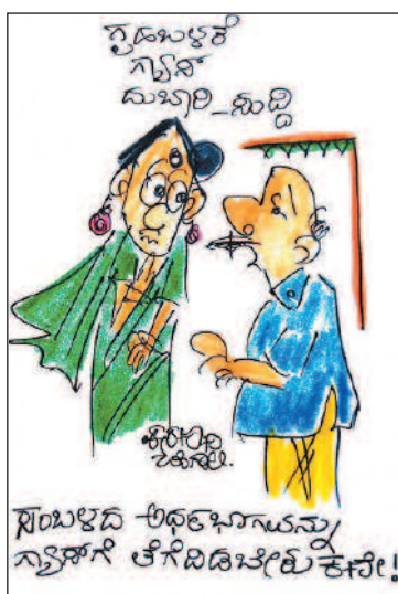
ನಿಂಬಿನಿಂದ ಅಧಿಕಾರವನ್ನು ಸ್ವಾಧೀನ ಮಾಡಿಕೊಳ್ಳುವ ಕೆಲಸ!