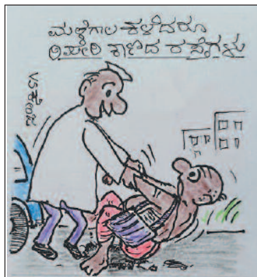
ಯಾಕೆ ಜೋಯಿಸರ್-ಕೊಂಡುವಿಗೆ ಸಲಿಮದ ಸ್ವಲ್ಪ ನೋಡಿ ರೋಡ್-ಟೆಲ್ಲವೇನು?