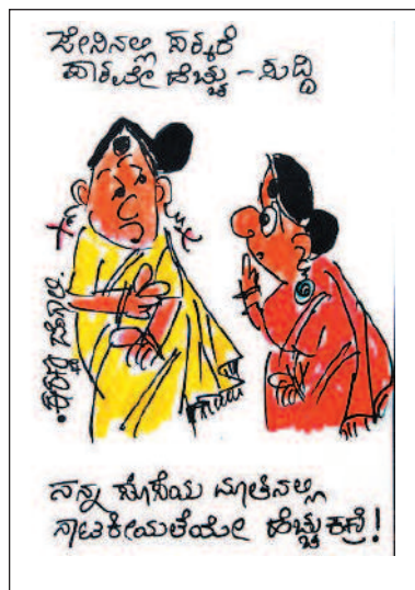
ನನ್ನ ಕೊಡುಗೆಯನ್ನು ಸ್ವೀಕರಿಸಿ ನಾನು ಕೊಟ್ಟು ಕೊಟ್ಟೆ!