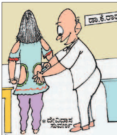
ನಿಮ್ಮ ಈ ಫ್ಯಾಷನ್ನಿನ ಉಡುಗೆಯಿಂದ ಸೊಂಟಕ್ಕೆ ಇಂಜೆಕ್ಷನ್ ಕೊಡಲು ಸುಲಭವಾಯ್ತು ನೋಡಿ!