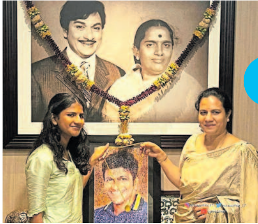
ಪುನೀತ್‌ಗೆ ಪತ್ನಿ-ಪುತ್ರಿಯಿಂದ 'ಕರ್ನಾಟಕ ರತ್ನ' ಪದಕ ಸಮರ್ಪಣೆ