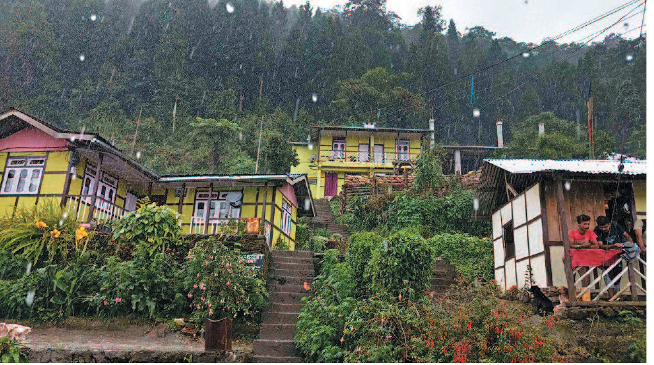
ಸಿಲೇರಿಗಾವ್ ಮನೆಗಳ ಒಂದು ಸುಂದರ ನೋಟ