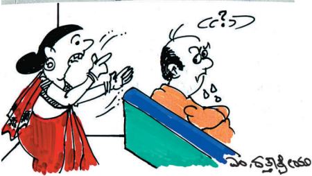
ಇಡೀ ದಿನ ಮನೇಲಿ ಕೂತು ಕಾಲಹರಣ ಮಾಡೋದರ ಬದಲಿಗೆ.. ಹೊರಗೆ ಹೋಗಿ 'ಇಲಿ'ಗಳನ್ನಾದರೂ ಹಿಡಿದುಕೊಂಡು ಬರಬಾರದೇನೇ..!

ಫ್ರೆಜರ್‌ನಲ್ಲಿ ವಾಕ್ಯ ಫ್ರೆಜರ್‌ನಲ್ಲಿ ವಾಕ್ಯ ಗ್ರಾಫಿಕ್ಸ್ ಕೆಲಸ ಫ್ರೆಜರ್‌ನಲ್ಲಿ ವಾಕ್ಯ ಗ್ರಾಫಿಕ್ಸ್ ಕೆಲಸ ಫ್ರೆಜರ್‌ನಲ್ಲಿ ವಾಕ್ಯ ಗ್ರಾಫಿಕ್ಸ್ ಕೆಲಸ