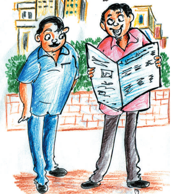
ಕೆಲವರ ಕಷ್ಟಗಳು ಅದ್ದೇಗೆ ಮಂಜಿನಂತೆ ಕರಗಿ ಹೋಗುವೆ ಅಲ್ತಾ?