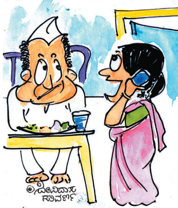
ಹಲೋ ಜೈಲಾ? ನಿಮ್ಮ ಅಡುಗೆ ಉಂಡು ನಮ್ಮ ಜಮಾನು ಕೊಲೆಸ್ವಾಲ್ ಪೂರ್ತಿ ಕಡಿಮೆಯಾಗಿದೆ. ಸ್ವಲ್ಪ ಅಡುಗೆ ರೆಸಿಪಿ ತಿಳಿಸೀರಾ?