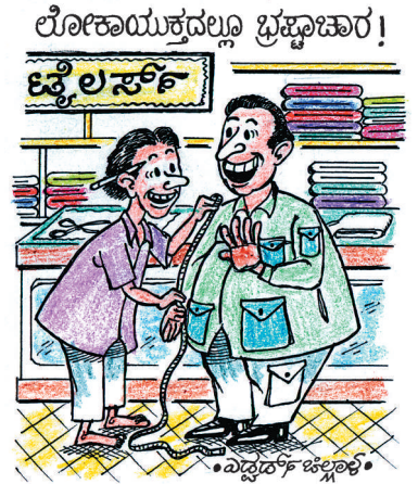
ಲೋಕಾಯುಕ್ತದಲ್ಲಿ ಭ್ರಷ್ಟಾಚಾರ! ಟೈಲರ್ಸ್ ಇನ್ನೊಂದ್ನು ಜೇಬುಗಳನ್ನು ಎಲ್ಲಾದರೂ ಇಟ್ಟಿಡೆಯ್ಯಾ.. ನನಗೆ ಲೋಕಾಯುಕ್ತಕ್ಕೆ ವರ್ಗವಾಗಿದೆ.