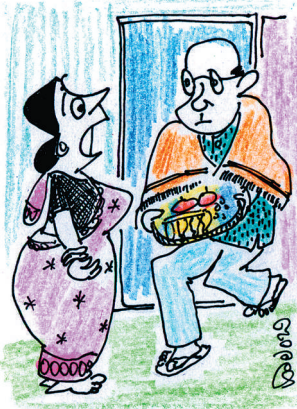
ಮತ್ತೆ.. ಯಾರೋ ಸನ್ಮಾನ ಮಾಡಿದ್ರಾ? ಮನೇಲಿ ಜಾಗ ಇಲ್ಲ.. ಒಂದು ಶಾಲು ಮಾರಾಟ ಮಳಿಗೆ ಆರಂಭಿಸಿ!