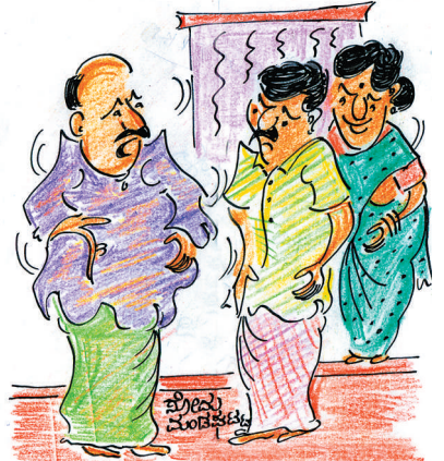
ರೀ... ನೀವು ನಿಮ್ಮ ಹೆಂಡ್ತಿ ಎಷ್ಟಾದ್ರೂ ಜಗಳ ಮಾಡ್ಕೊಳ್ಳಿ.. ಪದೇ ಪದೇ ಮನೆ ಹಾಕಾಯ್ತು ಅನ್ನೇಡಿ.. ನೀವಿರೋದು ಬಾಡಿಗೆ ಮನೆ..!