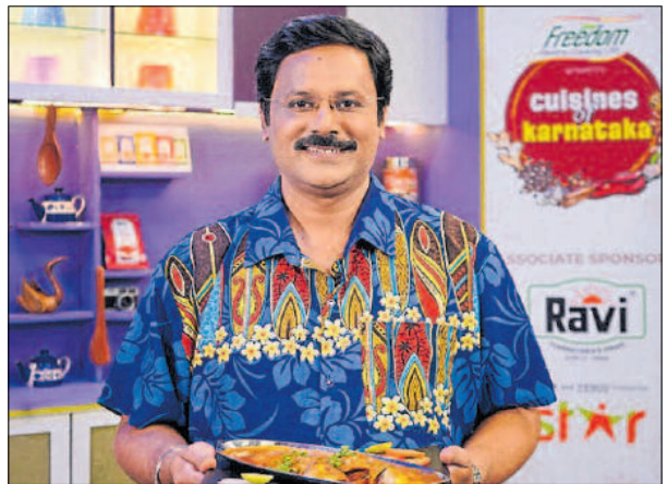
ಕೊಂಕಣಿ ಶೈಲಿ ಫಿಶ್ ಸಾರಿನ ಜತೆ ಆದರ್ಶ್ ತತ್ವತಿ