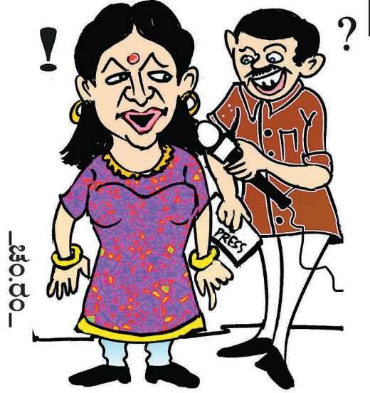
ಚೆಡಿಎಸ್‌ನಲ್ಲಿ ಹುಲ್ಲಿನ ಹೊರೆ ಹೊತ್ತು ಸಾಕಾಗಿ ಹೋಗಿತ್ತು..!