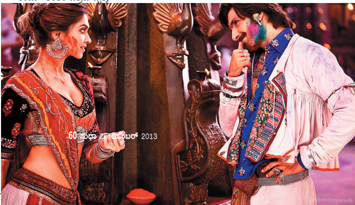
60ನೇ ಪುಟ 29ನೇ ಸೆಪ್ಟೆಂಬರ್ 2013