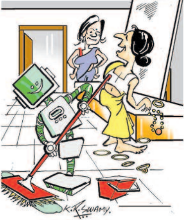
ಇದನ್ನು ಕೆಲವಕ್ಕೆ ಬಿಟ್ಟು ಕೊಂಡ ಮೇಲೆ ಬಂಗಾರ ಎಲ್ಲ ಬೀಳುತ್ತಿತ್ತು ಕಟ್ಟನ ಆಗಲ್ಲ.

ಮಗ: ಅಪ್ಪ, ನಾಳೆ ನಾನು ನಾಟಕದಲ್ಲಿ ಗಂಡನ ಪಾತ್ರ ಮಾಡುತ್ತಿದ್ದೇನೆ. ಅಪ್ಪ: ಯಾಕೋ ಗೂಬೆ, ಬೇರೆ ಪಾತ್ರ ಸಿಗಲಿಲ್ಲವೇ? ಮಗ: ಅದೇ ತುಂಬ ಸುಲಭದ ಪಾತ್ರ ಅಪ್ಪ. ಯಾವುದೇ ಡೈಲಾಗ್ ಹೇಳೋ ಅಗತ್ಯವೇ ಇಲ್ಲ ಈ ಪಾತ್ರದಲ್ಲಿ.