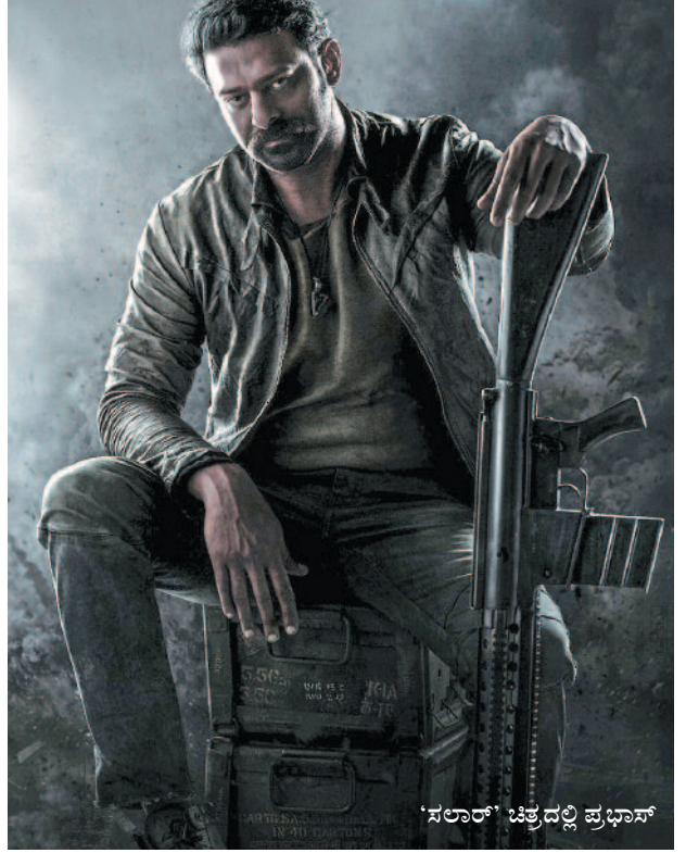
'ಸಲಾರ್' ಚಿತ್ರದಲ್ಲಿ ಪ್ರಭಾಸ್

'ರಾಜಕುಮಾರ್', 'ಕೆಜಿಎಫ್'ನಂಥ ಹಿಟ್ ಸಿನಿಮಾಗಳನ್ನೇ ಕೊಟ್ಟಿರುವ ಹೊಂಬಾಳೆ ಫಿಲ್ಮ್ ನಿರ್ಮಾಣ ಸಂಸ್ಥೆ ತನ್ನ ಮುಂದಿನ ಸಿನಿಮಾ ಘೋಷಿಸಿದೆ. 'ಕೆಜಿಎಫ್' ಎರಡು ಭಾಗಗಳನ್ನು ನಿರ್ದೇಶಿಸಿದ್ದ ಪ್ರಶಾಂತ್ ನೀಲ್ ನಿರ್ದೇಶನದಲ್ಲಿ ತೆಲುಗಿನ ಸೂಪರ್‌ಸ್ಟಾರ್ ಪ್ರಭಾಸ್ ನಾಯಕನಾಗಿ ನಟಿಸುತ್ತಿರುವ 'ಸಲಾರ್' ಚಿತ್ರವನ್ನು ಬಿಗ್ ಬಜೆಟ್‌ನಲ್ಲಿ ನಿರ್ಮಾಣ ಮಾಡುವುದಾಗಿ ಹೊಂಬಾಳೆ ಫಿಲ್ಮ್ ಇತ್ತೀಚೆಗೆ ಸಾಮಾಜಿಕ ಜಾಲತಾಣಗಳಲ್ಲಿ ಹೇಳಿಕೊಂಡಿದೆ.