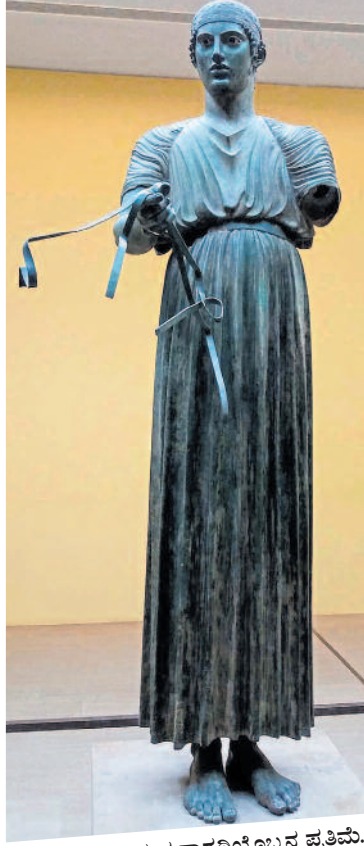
ಮ್ಯೂಸಿಯಂ ನಲ್ಲಿರುವ ಸಾರಥಿಯೊಬ್ಬನ ಪ್ರತಿಮೆ.

ಕೇಂದ್ರಸ್ಥಾನವೆಂದು ತಿಳಿದಿದ್ದರಂತೆ. ಅದಕ್ಕಾಗಿ ಒಂಫಲೋಸ್ ಎಂಬ ಕಲ್ಲಿನ ಸ್ಮಾರಕವನ್ನು ಸಹ ಕಟ್ಟಿ ನಿಲ್ಲಿಸಿದ್ದರು. ಒಂಫಲೋಸ್ ಎಂದರೆ ಪುರಾತನ ಗ್ರೀಕ್ ಭಾಷೆಯಲ್ಲಿ ನಾಭಿ ಎಂಬರ್ಥ. ಗುಡುಗು, ಮಿಂಚುಗಳ ದೇವತೆಯಾದ ಜೂಸ್ ಭೂಮಿಯ ಕೇಂದ್ರವೆಂದೆ ಎಂದು ಹುಡುಕಲು ಜಗತ್ತಿನ ಎರಡು ತುದಿಗಳಿಂದ ಒಂದೊಂದು ಹದ್ದುಗಳನ್ನು ಹಾರಿಸಿಬಿಟ್ಟಂತೆ. ಅವು ಹಾರಿ ಬಂದು ಭೇಟಿಯಾದದ್ದು ಡೆಲ್ಲಿಯಲ್ಲಿ ಎಂಬ ಸ್ವಾರಸ್ಯಕರವಾದ ಕಥೆ ಅವರ ಪುರಾಣದಲ್ಲಿದೆ. ಸುಮಾರು ಮೂರುವರೆ ಗಂಟೆಗಳ ಪ್ರಯಾಣದ ನಂತರ ಬಸ್ ಡೆಲ್ಲಿ ತಲುಪಿತು. ಸುತ್ತಲೂ ಹಸಿರುಬೆಟ್ಟಗಳ ಸಾಲು ಸಾಲು, ಕಣಿವೆಯಾಳದಲ್ಲೊಂದು ನೀಲಿ ಸರೋವರ, ಬೆನ್ನಿಗೇ ಕಾಣುವ ಪುರಾತನ ಅವಶೇಷಗಳು, ಆ ಅವಶೇಷಗಳ ಬದಿಯಲ್ಲೇ ಬೆಳೆದಿದ್ದ ಹೊಸ ಪಟ್ಟಣ ಇವಿಷ್ಟೂ ನಮ್ಮನ್ನು ಎದುರುಗೊಂಡವು. ಬಸ್ ನಿಲ್ದಾಣದಿಂದ ಕೆಲ ಹೆಜ್ಜೆಗಳಷ್ಟು ದೂರದಲ್ಲಿ ಉತ್ಕನನ ಪ್ರದೇಶದ ಪ್ರವೇಶ ದ್ವಾರವಿತ್ತು. ಸುಮಾರು 12 ಯುರೋಗಳಷ್ಟು ದುಡ್ಡು ತೆತ್ತು ಟಿಕೆಟ್ ಕೊಂಡುಕೊಂಡು ಒಳನಡೆದೆವು.