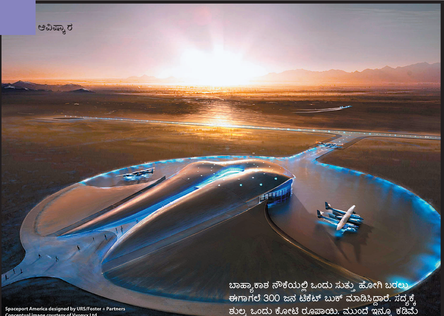
Spaceport America designed by URS/Foster + Partners

ಬಾಹ್ಯಾಕಾಶ ನೌಕೆಯಲ್ಲಿ ಒಂದು ಸುತ್ತು ಹೋಗಿ ಬರಲು ಈಗಾಗಲೇ 300 ಜನ ಟಿಕೆಟ್ ಬುಕ್ ಮಾಡಿಸಿದ್ದಾರೆ. ಸದ್ಯಕ್ಕೆ ಶುಲ್ಕ ಒಂದು ಕೋಟಿ ರೂಪಾಯಿ. ಮುಂದೆ ಇನ್ನೂ ಕಡಿಮೆ ಆಗಬಹುದು!