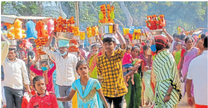
ಇಲ್ಲಿ ಗಂಡುಮಕ್ಕಳಿಗೂ ಆರತಿ ಹೊರುವ ಭಾಗ್ಯ

ಜಾತ್ರೆಗೆ ಬರುವ ಭಕ್ತಾದಿಗಳು ತಾವು ಬೆಳೆದ ಕಡಲೆಕಾಯಿ, ತೊಗರಿಕಾಯಿ, ನೆಲ್ಲ, ಮೆಣಸಿನಕಾಯಿ ಮೊದಲಾದ ಧಾನ್ಯಗಳನ್ನು ಮಡಿಲು ಕಟ್ಟಿಕೊಂಡು ಬರುವುದು ಸಾಮಾನ್ಯ. ನರಸಿಂಹ ಸ್ವಾಮಿ ದೇವಾಲಯಕ್ಕೆ ಮೂರು ಸುತ್ತು ಬರುವ ಭಕ್ತರು ತಮ್ಮ ಹೊಲದ ದವಸ ಧಾನ್ಯಗಳನ್ನು ಗುಡಿಯ ಮೇಲೆ ತೂರುತ್ತಾರೆ. ಕಾಡು ಹಂದಿ, ಕರಡಿ ಹೊಲಕ್ಕೆ ಬರದಂತೆ ರಕ್ಷಿಸಿ, ಸಮೃದ್ಧ ಸುಗ್ಗಿ ಕೊಟ್ಟಿದ್ದಕ್ಕೆ ದೇವರಿಗೆ ಕೃತಜ್ಞತೆ ಹೇಳುತ್ತಾರೆ. ಹೊಲ ಇಲ್ಲದ ಬಡವರು, ಎರಚಿದ ಬೀಜಗಳನ್ನು ಗುಡಿಸಿ ಸಂಗ್ರಹಿಸಿಕೊಳ್ಳುತ್ತಾರೆ.