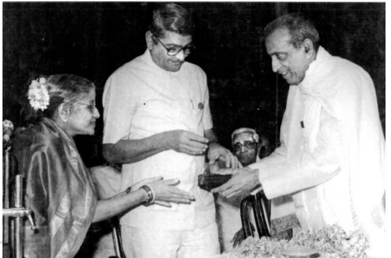
ಸಂಗೀತ ಕಲಾನಿಧಿ ಪ್ರಶಸ್ತಿ ಎಂ.ಎಸ್. ಮುಬ್ಬಲಕ್ಕಿ ಅವರಿಂದ

ವೀಣೆ ನುಡಿಸಾಣಿಕೆಯಲ್ಲಿ ಹೊಸ ಹೊಸ ತಂತ್ರಗಾರಿಕೆಗಳನ್ನು ಕಲಿತು ಅದನ್ನು ತಮ್ಮ