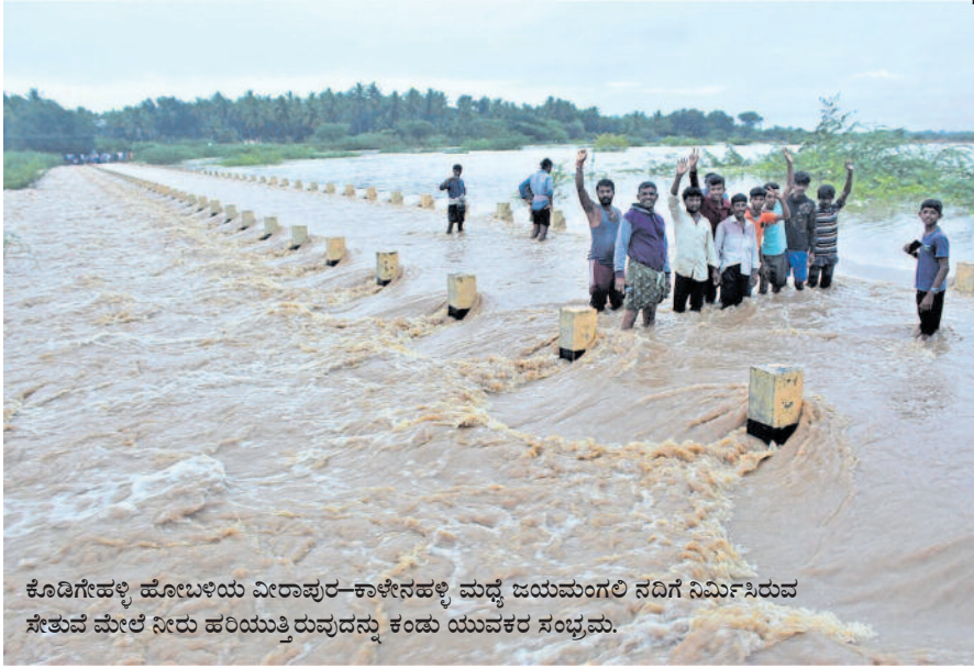
ಕೊಡಿಗೇಹಳ್ಳಿ ಹೋಬಳಿಯ ವೀರಾಪುರ-ಕಾಳೇನಹಳ್ಳಿ ಮಧ್ಯೆ ಜಯಮಂಗಲಿ ನದಿಗೆ ನಿರ್ಮಿಸಿರುವ ಸೇತುವೆ ಮೇಲೆ ನೀರು ಹರಿಯುತ್ತಿರುವುದನ್ನು ಕಂಡು ಯುವಕರ ಸಂಭ್ರಮ.