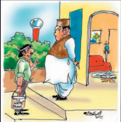
ಎಲ್ಲಾ ಬಣಿ ಮಾಡಿ ಕೊಡ್ತೀನಿ ಅಂತ ಫೋನ್ ಮಾಡಿದ್ದು ನಾನೇ...!! ಡೋಂಟ್ ವಲಿ ಮಾಡ್ಕೊ ಬೇಡಿ !