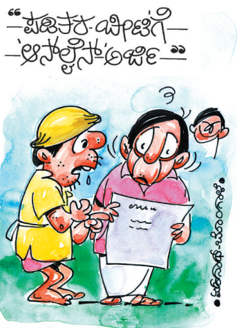
'ಆನ್‌ಲೈನ್' ಹಾಗಂದೇನು? ಪಡಿತರ ಎಲ್ಲಾನೂ ಅದಲ್ಲೇ ಬರುತ್ತಾ ಮಾರಾಯ್ತೆ..?