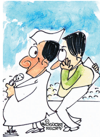
ನಿರ್ಭಯವಾಗಿ ಭಾಷಣ ಮಾಡಿ ಸಾರ್ ವೇದಿಕೆ ಸುತ್ತ ಒಂದೂ ಕಲ್ಲು ಸಿಗದಂತೆ ಸ್ವಚ್ಛ ಮಾಡಿಸಿದ್ದೇನೆ!