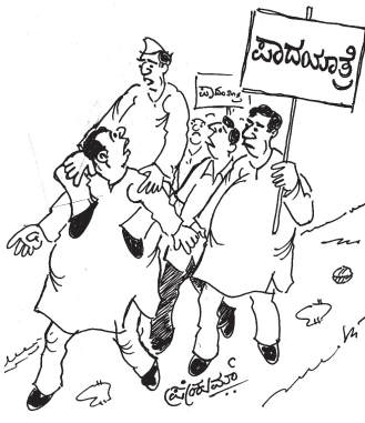
ನಾನು ಬರೋದಿಲ್ಲಾ.. ಕಾಲು ನೋವು ನಡೆಯಲು ಆಗೋದಿಲ್ಲಾಂದ್ರೂ ನೀವೇ ಒತ್ತಾಯ ಮಾಡಿ ಕರೆತಂದಿದ್ದು..!