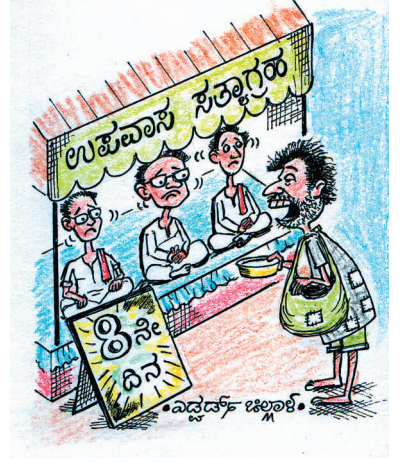
ನಾಲ್ಕು ದಿನದಿಂದ ಏನೂ ತಿಂದಿಲ್ಲ ತಿನ್ನೋಕೇನಾದ್ರೂ ಇದ್ದೆ ಕೊಂಚ ಹಾಕಿ ಸ್ವಾಮಿ