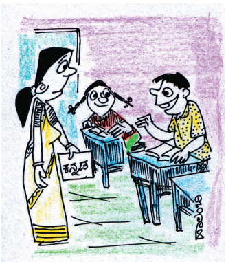
'ಉಲ್ಟಾ' ಪದ ಸೇರಿಸಿ ವಾಕ್ಯ ಮಾಡಬೇಕಾ? 'ಬಂಧನಕ್ಕೆ ಒಳಗಾದಾಕ್ಷಣ ಮಂತ್ರಿಗೆ ರೋಗ ಉಲ್ಟಾಣವಾಗಿ ಆಸ್ಪತ್ರೆ ಸೇರಿದೆ'!