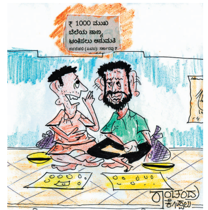
ನೋಡಿದ್ದು... ನಮಗೂ ಒಳ್ಳೆ ಕಾಲ ಬರುತ್ತೆ... ಜನ ನಮ್ಮನ್ನೆ ಕೈ ಬಿಡೋದಿಲ್ಲ..!