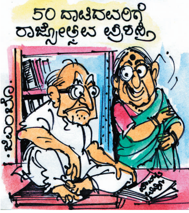
50 ದಾಟಿದವರಿಗಷ್ಟೇ 'ಮಂತ್ರಿ' ಮಾಡಲು ಹೇಳಬೇಕೆಂದು ರೀ.. ಆಗ್ಲಾದ್ರೂ ನಿಮಗೆ ಅವಕಾಶ ಸಿಗುತ್ತಿತ್ತು..