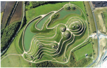
ಲ್ಯಾಂಡ್ ಸ್ಕೇಪ್ ಲಲನೆ -ವಿದ್ಯಾ ವಿ.ಹಾಲಭಾವಿ