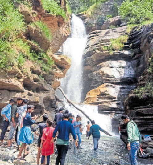
ಎದೆಯೊಳಗೂ ಹೊರಗೂ ಭೋರ್ಗರತ!