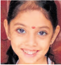
ಧಾತ್ರಿ ಎಶ್ 1ನೇ ತರಗತಿ, ಶ್ರೀ ಸತ್ಯ ಸಾಯಿ ಲೋಕ ಸೇವಾ ಪ್ರಾಥಮಿಕ ಶಾಲೆ ಅಳಿಕ, ದ.ಕ. ಜಿಲ್ಲೆ