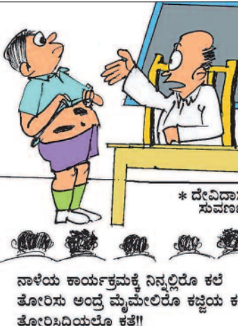
* ದೇವಿದಾಸ ಸುವರ್ಣ ನಾಳೆಯ ಕಾರ್ಯಕ್ರಮಕ್ಕೆ ನಿನ್ನಲ್ಲಿರೋ ಕಲೆ ತೋರಿಸು ಅಂದ್ರೆ ಮೈಮೇಲಿರೋ ಕಟ್ಟಿಯ ಕಲೆ ತೋರಿಸ್ತಿದ್ದಿಯಲ್ಲೋ ಕತ್ತೆ!!