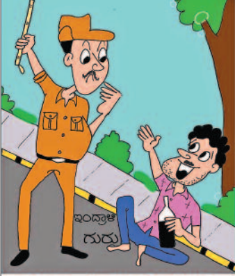
ಮಳೆ ಬಂದು ರಸ್ತೆ ಎಲ್ಲಾ ಹೊಂಡಗಳಾಗಿವೆ. ನನ್ನನ್ನು ನಿಮ್ಮ ವಾಹನದಲ್ಲಿ ಮನೆವರೆಗೂ ಡ್ರಾಪ್ ಮಾಡಿ ಸಾರ್.