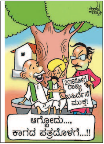
ಆಗ್ಲೊಂದು... ಕಾಗದ ಪತ್ರದೊಳಗೆ...!! 2018ರೊಳಗೆ ರಾಜ್ಯ ಬಹಿರ್ದೇಶನೆ ಮುಕ್ತ!