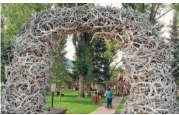
ಜಿಂಕೆ ಕೊಂದಿನ ಕಮಾನು -ಮಂಜುಳಾ ರಾಜ್