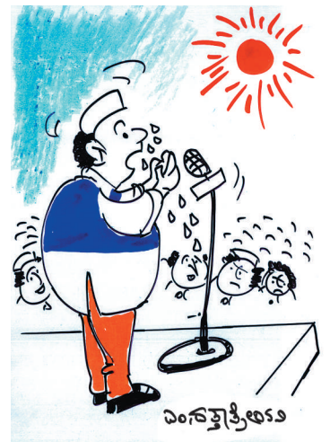
ದಯವಿಟ್ಟು ನನ್ನನ್ನು ನಂಬಿ. ಮತ್ತೆ 'ಜೈಲಿ'ಗೆ ಹೋಗುವಂತಹ ತಪ್ಪು ಮಾಡುವುದಿಲ್ಲ!