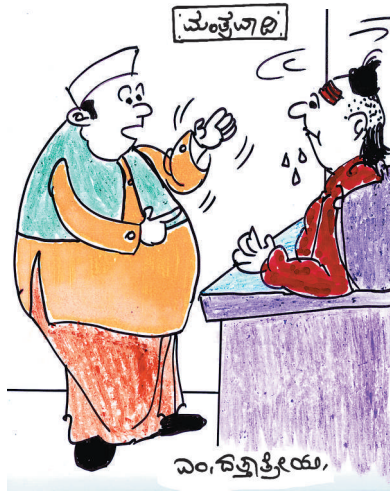
ಎಷ್ಟಾದರೂ 'ಹಣ' ತಗೊಳ್ಳಿ 'ಜೈಲಿ'ಗೆ ಹೋಗೋದನ್ನ ತಪ್ಪಿಸಿಕೊಳ್ಳುವಂತೆ ಒಂದು ಯಂತ್ರ ಮಾಡಿ ಕೊಡಿ ಸ್ವಾಮಿ!