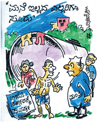
ಇಲ್ಲಿ ಬಿಡಿ ಸ್ವಾಮಿ, ಮೂರು ವರ್ಷ ಹಾಗೂ ಹೀಗೂ ಇಲ್ಲೇ ಕಳೆದಿದ್ದೇವೆ, ಇನ್ನು ಎರಡು ವರ್ಷ ಕಳೆಯೋದು ಏನು ಮಹಾ!