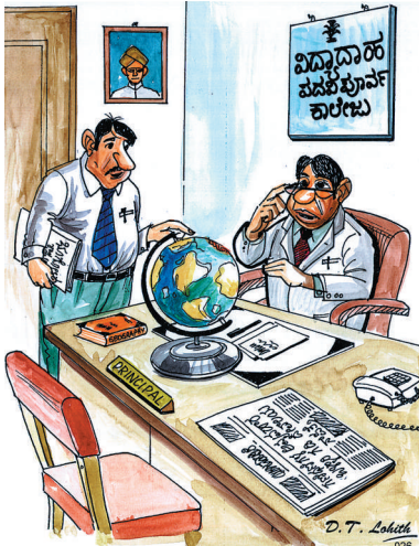
ಬಿಡುಗಡೆ ಎಲ್ಲಿ ಅಂತ ಹುಡುಕುತ್ತಾ ಇದೀರಾ ಸಾರ್, ಇಲ್ಲಿ ದೊಡ್ಡ ಹೊಂದ ಕಾಣುತ್ತಾ ಇದೆಯಲ್ಲಾ, ಅದೇ !!