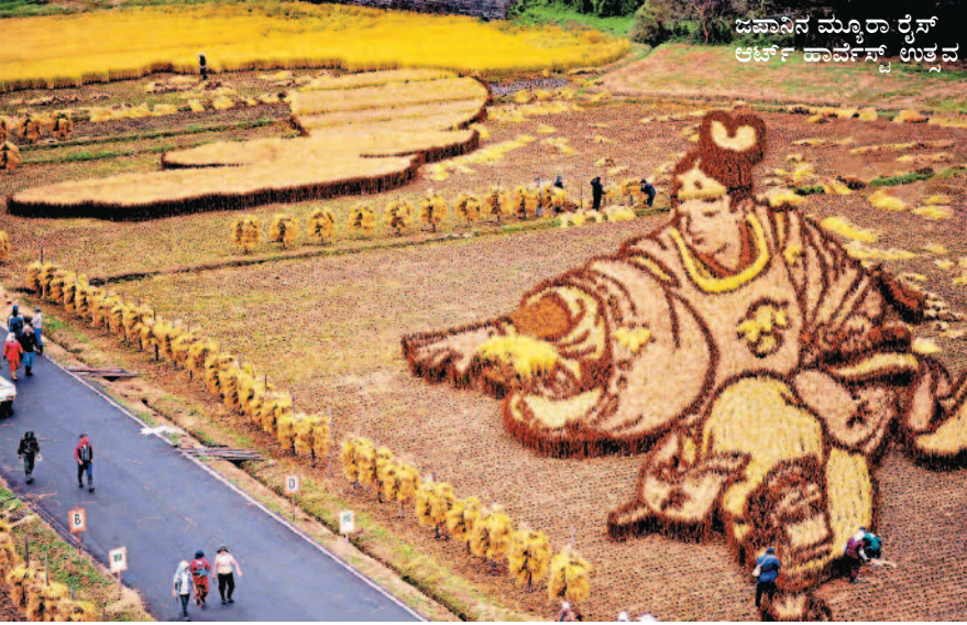
ದವಾನಿನ ಮ್ಯೂರಾ ರೈಸ್ ಆರ್ಟ್ ಹಾರ್ವೆಸ್ಟ್ ಉತ್ಸವ