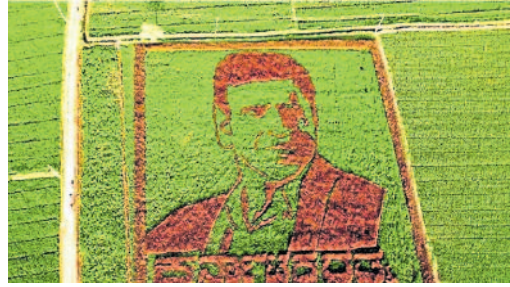
ರಾಯಚೂರಿನಲ್ಲಿ ಭತ್ತದ ಬೆಳೆಯಲ್ಲಿ ಅರಳಿದ ನಟ ಪುನೀತ್ ರಾಜ್‌ಕುಮಾರ್ ಚಿತ್ರ