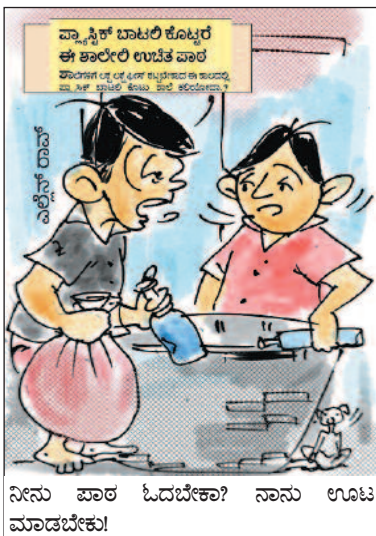
ನೀನು ಪಾಲ ಓದಬೇಕಾ? ನಾನು ಊಟ ಮಾಡಬೇಕು!