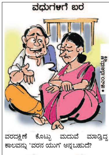
ವರದಕ್ಷಿಣೆ ಕೊಟ್ಟು ಮದುವೆ ಮಾಡ್ತಿದ್ದ ಕಾಲವನ್ನು 'ವರನ ಯುಗ' ಅನ್ನಬಹುದೇ?