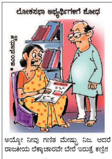
ಅಯ್ಯೋ ನೀವು ಗಣಿತ ಮೇಷ್ಟ್ರು ನಿಜ. ಆದರೆ ರಾಜಕೀಯ ಲೆಕ್ಕಾಚಾರವೇ ಬೇರೆ ಇರುತ್ತೆ ಕಣ್ಣಿ!