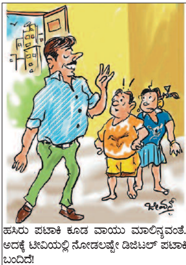
ಹಸಿರು ಪಟಾಕಿ ಕೂಡ ವಾಯು ಮಾಲಿನ್ಯವಂತೆ. ಅದಕ್ಕೆ ಟೀವಿಯಲ್ಲಿ ನೋಡಲಷ್ಟೇ ಡಿಜಿಟಲ್ ಪಟಾಕಿ ಬಂದಿದೆ!