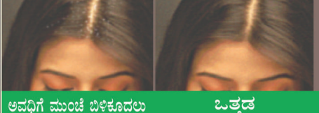
ಮೊದಲು ನಂತರ ಅವಧಿಗೆ ಮುಂಚೆ ಬಿಳಿಕೂದಲು ಒತ್ತಡ