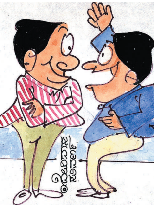
ಟಿವಿಯಲ್ಲಿ ಸಿನೇಮಾ ಮಧ್ಯೆ ತುರುಕುವ ಜಾಹೀರಾತುಗಳಿಂದ ಬೇಸತ್ತು ಜನ ಈಗ ಥಿಯೇಟರಿನತ್ತ ಧಾವಿಸ ತೊಡಗಿದ್ದಾರೆ.