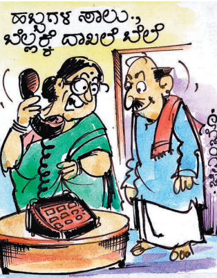
ಒಂದು ಸಿಹಿ ಸುದ್ದಿ.. ಕಣ್ಣೇ! ಸಿಹಿ ಅಂದ್ರೆ ಆಗಲ್ಲ, ಸಿಹಿತಿಂಡಿ ಏನೂ ಮಾಡ್ಯೇಡಿ ಅಂತ ನಮ್ಮ ಅಳಿಯ ಕರೆ ಮಾಡಿದ್ದಾರೆ!