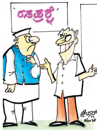
ಭ್ರಷ್ಟಾಚಾರವಿಲ್ಲದ ಒಬ್ಬ ರಾಜಕಾರಣಿಯ ಹೆಸರು ಹೇಳಿ ಅಂತ ಸಾರ್ವಜನಿಕರಿಗೆ ಕ್ವಿಜ್ ಇಟ್ಟಿದ್ದೆವು.. ಆದರೆ ಒಬ್ಬರಿಗೂ ಹೆಸರು ಹೇಳಲು ಸಾಧ್ಯವಾಗಲಿಲ್ಲ...