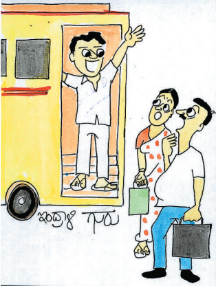
ಸಕಲೇಶಪುರ.. ಹಾಸನ.. ಗಾರ್ಬೆಜ್ ಸಿಟಿ!