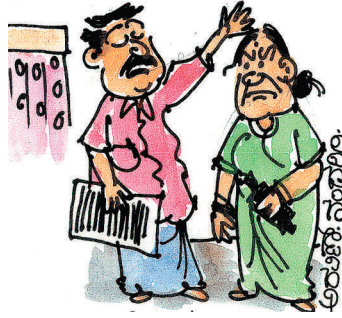
ಅಧ್ಯಾಪಕ ಕೆಟ್ಟ ಗಲಿಗೆಯಲ್ಲಿ ನೀನು ನನ್ನ ಜೀವನದಲ್ಲಿ 'ನೀಲಂ'ದಂತೆ ಬಂದೆಯೋ?