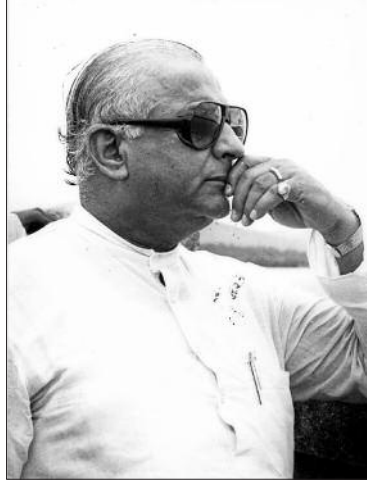
ರಾಜಕಾರಣದಲ್ಲಿ ಹಿಂದುಳಿದ ವರ್ಗಗಳಿಗೆ ಧ್ವನಿ ದೊರಕಿಸಿಕೊಟ್ಟ ದೇವರಾಜ ಅರಸು

'ನೇಗಿಲಯೋಗಿ' ಪದ್ಯ ಪ್ರಸಾರವಾಗುತ್ತಿದ್ದ ಆಸುಪಾಸಿನಲ್ಲೇ ಬಂದ ಕಾರಂತರ 'ಚೋಮನ ದುಡಿ'ಯಲ್ಲಿ ದಲಿತ ಚೋಮ 'ತನ್ನ ಹಣೆಯಲ್ಲಿ ನೇಗಿಲಿನ ಯೋಗ ಬರೆಯಲಿಲ್ಲವೆಂದು ಚಿಂತಿಸುತ್ತಿದ್ದ' ಎಂಬ ಮಾತು ಬರುತ್ತದೆ. ಬ್ರಾಹ್ಮಣ ಜಮೀನ್ದಾರ ಸಂಕಷ್ಟಯ್ಯನವರ ಆಳಾದ ಚೋಮನಿಗೆ 'ಬೇಸಾಯಗಾರನಾಗಬೇಕೆಂಬ ಆಸೆ ಕುತ್ಸಿಗೆಯವರೆಗೆ'; ಆದರೆ ಸಂಕಷ್ಟಯ್ಯನನ್ನು 'ನಾಲ್ಕು ಗೇಣು ಜಾಗ ನನಗೆ ಕೊಡಿ' ಎಂದು ಕೇಳುವ ಸಾಹಸವಿಲ್ಲ. 'ದನಿಯರಲ್ಲಿಗೆ ಹೋಗಿ ಒಂದು ಮುಡಿ ಗದ್ದೆಯನ್ನಾದರೂ ತನಗೆ ಗೇಣಿಗೆ ಕೊಡಬೇಕೆಂದು ಕೇಳುವುದು ಎಂದು ಆತ ಮನಸ್ಸು ಮಾಡಿದ್ದಾನೆ.' ಕೊನೆಗೂ ಚೋಮನಿಗೆ