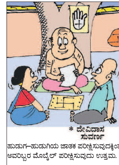
* ದೇವಿದಾಸ ಸುವರ್ಣ ಹುಡುಗ-ಹುಡುಗಿಯ ಜಾತಕ ಪರಿಷ್ಕರಿಸುವುದಕ್ಕಿಂತ ಅವರಿಬ್ಬರ ಮೊಬೈಲ್ ಪರಿಷ್ಕರಿಸುವುದು ಉತ್ತಮ.