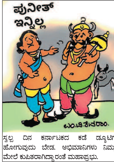
ಸ್ವಲ್ಪ ದಿನ ಕರ್ನಾಟಕದ ಕಡೆ ಡ್ಯೂಟಿ ಹೋಗುವುದು ಬೇಡ. ಅಭಿಮಾನಿಗಳು ನಿಮ್ಮ ಮೇಲೆ ಕುಪಿತರಾಗಿದ್ದಾರೆಂತೆ ಮಹಾಪ್ರಭು.