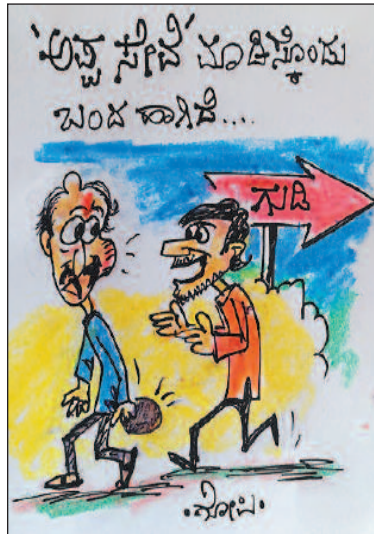
ಅಪ್ಪ ಸುಧಿ ಮಾಡಿಸ್ಕೊಂಡು ಬಂದ ಕಾಸಿಡೆ...