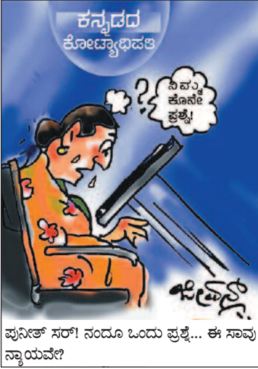
ಪುನಿತ್ ಸರ್! ನಂದೂ ಒಂದು ಪ್ರಶ್ನೆ... ಈ ಸಾವು ನ್ಯಾಯವೇ?