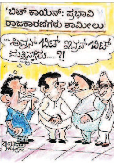
ಬಿಟ್ ಕಾಯಿನ್: ಪ್ರಭಾವಿ ರಾಜಕಾರಣಿಗಳು ಶಾಮೀಲು... ಅದನ್ನ ಬಿಟ್ ಅದನ್ನ ಬಿಟ್ ಮತ್ತಿನ್ನಾರು...?!