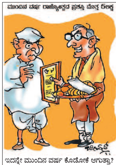
ಇದನ್ನೇ ಮುಂದಿನ ವರ್ಷ ಕೊಡೋಕೆ ಆಗುತ್ತಾ?