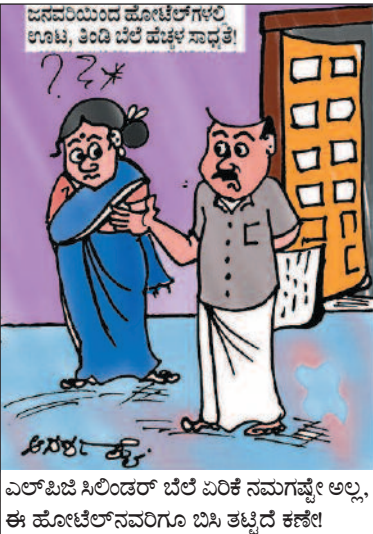
ಎಲ್‌ಪಿಜಿ ಸಿಲಿಂಡರ್ ಬೆಲೆ ಏರಿಕೆ ನಮಗಷ್ಟೇ ಅಲ್ಲ, ಈ ಹೋಟೆಲ್‌ನವರಿಗೂ ಬಿಸಿ ತಟ್ಟಿದೆ ಕಣೇ!