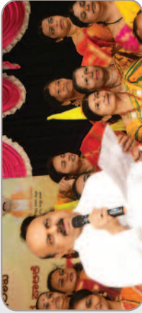
ಕುಟ್ಟಿಣಿಯಲ್ಲಿ ನಡೆದ 'ಮಾತಾಡ್ ಮಾತಾಡ್ ಕನ್ನಡ' ಕಾರ್ಯಕ್ರಮದಲ್ಲಿ ಸನ್ಮಾನ್ಯ ಮುಖ್ಯಮಂತ್ರಿ ಶ್ರೀ ಬಸವರಾಜ ಎನ್. ಬೊಮ್ಮಾಯಿ ಅವರು ಕನ್ನಡಕ್ಕಾಗಿ ಎತ್ತಿದ ಧ್ವಜ

ಕನ್ನಡಕ್ಕಾಗಿ ನಾವು ಕರ್ನಾಟಕ ರಾಜ್ಯೋತ್ಸವ ಅಭಿಯಾನ