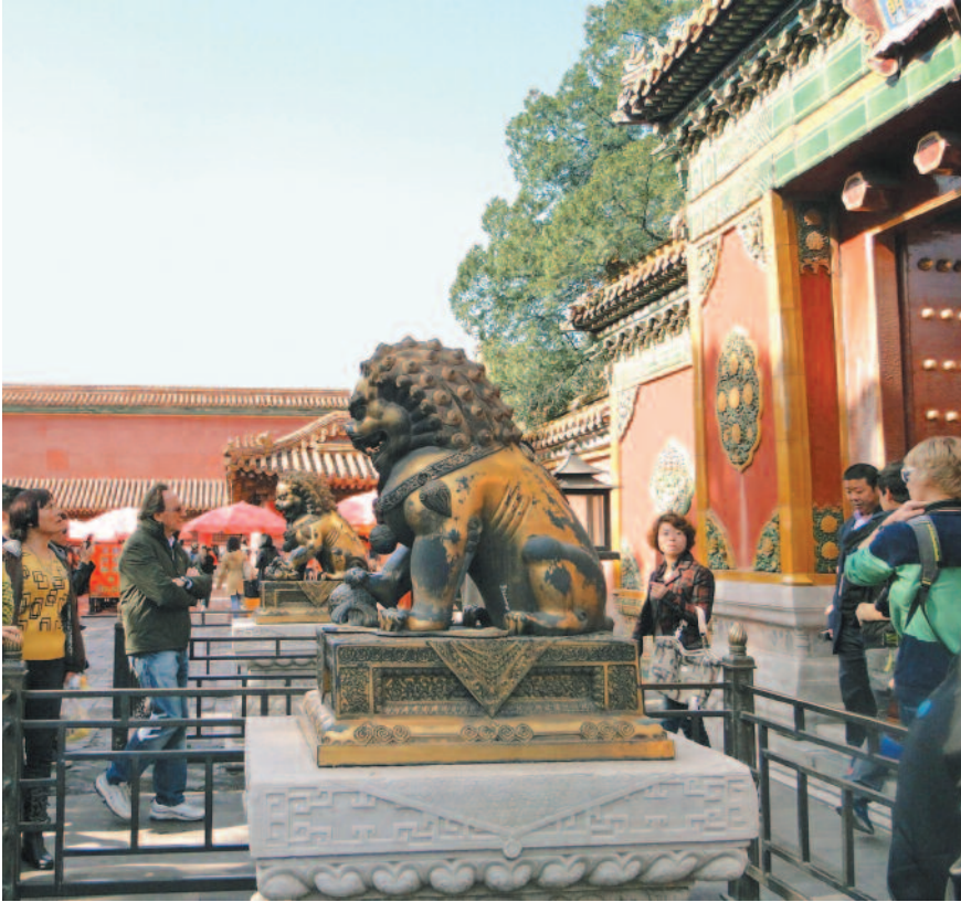
ಅರಮನೆಯ ಎದುರು ಕಂಚಿನ ಸಿಂಹದ ಪ್ರತಿಮೆ

ಎರಡೂ ಬದಿಯಲ್ಲಿ ಹಿತ್ತಾಳೆಯ ಸಿಂಹಗಳು ಮತ್ತು ನೀರು ತುಂಬಿಸಿಡುವ ಪಾತ್ರೆಗಳಿವೆ. ಇಡಿ ನಗರದಲ್ಲಿ 300ಕ್ಕೂ ಅಧಿಕ ಇಂತಹ ಪಾತ್ರೆಗಳಿವೆ. ಇದನ್ನು ದಾಟುತ್ತಿದ್ದಂತೆ ಎದುರಾಗುವುದು 'ಹೆವೆನ್ಲಿ ಪ್ಯುರಿಟಿ ಅರಮನೆ'. ಮಿಂಗ್ ಮನೆತನದ ರಾಜರ ಅರಮನೆಯಾಗಿತ್ತು, ಕ್ವಿಂಗ್ ಮನೆತನದ ರಾಜರು ಬಂದಾಗ ವಿದೇಶಿ ರಾಯಭಾರಿಗಳ ಸತ್ಕಾರ ಕೂಟಗಳೂ ಇಲ್ಲಿ ನಡೆಯುತ್ತಿದ್ದವಂತೆ. ರಾಜನ ಅರಮನೆ ದಾಟಿದರೆ ಸಿಗುವುದು ಪಟ್ಟದ ರಾಣಿಯ ಅರಮನೆ 'ಟೆರ್ರಿಸಿಯಲ್ ಟ್ರಾಂಕ್ವಿಲಿಟಿ ಅರಮನೆ'. ಅಕ್ಕಪಕ್ಕದಲ್ಲಿ, ಹಿಂದುಗಡೆ ರಾಜಕುಮಾರನ ಅರಮನೆ, ಕೆಲಸದವರ ಮನೆಗಳಿದ್ದರೆ ರಾಜನ ಇತರ ರಾಣಿಯರಿಗೋಸ್ಕರ ಪಶ್ಚಿಮ ಹಾಗೂ ಪೂರ್ವ ದಿಕ್ಕಿನಲ್ಲಿ ತಲಾ 6 ಅರಮನೆಗಳಿವೆ. ರಾಜನು ಭಾಷಣ ಬಾಯಿಪಾಠ ಮಾಡಲೂ ಪ್ರತ್ಯೇಕ ಪುಟ್ಟ ಕಟ್ಟಡವಿದೆ. ಒಂದು ಕಾಲದಲ್ಲಿ 3000 ಸುಂದರಿಯರು ನಗರದ ಒಳಭಾಗದಲ್ಲಿದ್ದರಂತೆ.