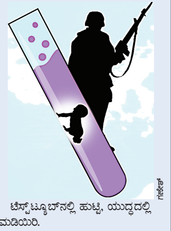
ಟೆಸ್ತ್‌ಟ್ಯೂಬ್‌ನಲ್ಲಿ ಹುಟ್ಟಿ, ಯುದ್ಧದಲ್ಲಿ ಮಡಿಯಿರಿ.