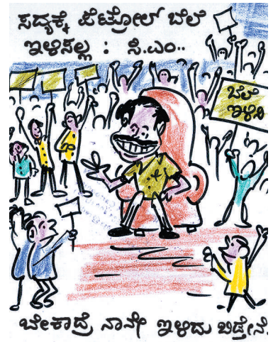
ಬೇಕಾದ್ರೆ ನಾನು ಇಳಿಸು ಬಡ್ಡೆನ.