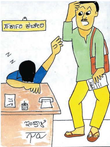
ಅರ್ಜಿ ನೋಡೋಕೆ ಕರೆಂಟಿಲ್ಲ ಹೋಗಯ್ಯೋ..!