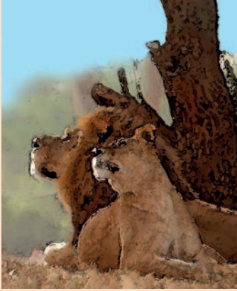
ಸಿಂಹಿಣಿ ಹೇಳಿದಂತೆಯೇ ಸಿಂಹ ಕೇಳುವುದು.