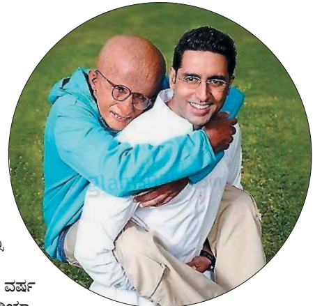
ಮಗನ ಹೆಗಲ ಮೇಲೆ ಅಮಿತಾಭ್

ಪಾ ಚಿತ್ರದಲ್ಲಿ ಅಮಿತಾಭ್ ನಿರ್ವಹಿಸಿದ್ದು 13 ವರ್ಷ ವಯಸ್ಸಿನ ಚಿಕ್ಕ ಹುಡುಗನ ಪಾತ್ರ! ಪ್ರೊಗೇರಿಯಾ ಎಂಬ ರೋಗಕ್ಕೆ ಒಳಗಾದ ಬಾಲಕನ ಹಾಗೂ ಆತನ ಅಪ್ಪನ ಭಾವುಕ ಸಂಬಂಧದ ಕುರಿತ ಕಥೆಯದು. ಪ್ರೊಗೇರಿಯಾ ಎಂದರೆ, ಅಕಾಲ ಮುಪ್ಪು ಆವರಿಸುವ ರೋಗ. ಎಷ್ಟೋ ಕೋಟಿ ಜನರಲ್ಲಿ ಒಬ್ಬರಿಗೆ ಇರುವ ಈ ಅಪರೂಪದ ರೋಗ ಬಂದವರು ದೈಹಿಕವಾಗಿ 13 ವರ್ಷವಾಗಿದ್ದರೂ ವೃದ್ಧಾಪ್ಯ ಆವರಿಸಿಬಿಡುತ್ತದೆ.