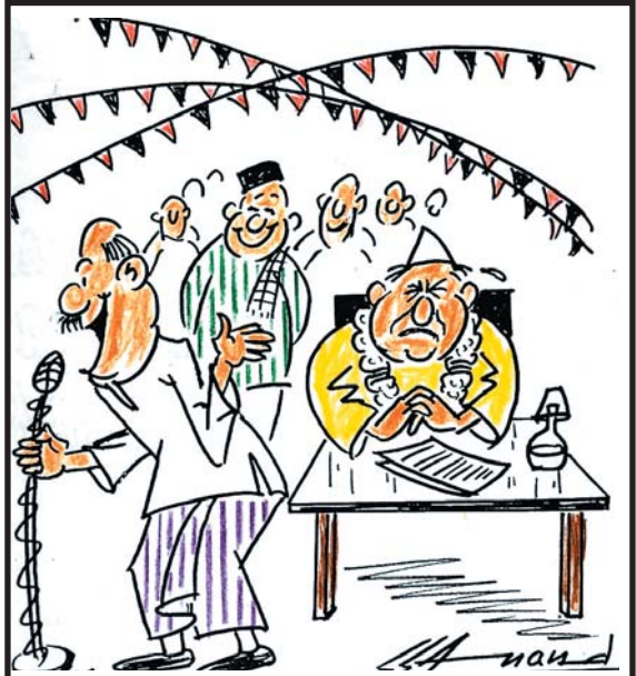
ವ್ಯಾಪಾರ, ಉದ್ಯಮ ಸ್ಥಾಪನೆಗೆ ಸಚಿವರು ಅನೇಕ ಯುವಕರಿಗೆ ಸಹಾಯ ಮಾಡಿದ್ದಾರೆ. ಮಗನಿಗೆ ಸಿಮೆಂಟ್ ಫ್ಯಾಕ್ಟರಿ, ಅಳಿಯನಿಗೆ ಗ್ಯಾಸ್ ಏಜೆನ್ಸಿ, ತಮ್ಮನಿಗೆ ಪೆಟ್ರೋಲ್ ಬಂಕು..