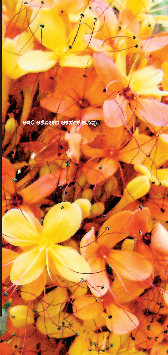
ಅಸಲಿ ಅಶೋಕದ ಆಕರ್ಷಕ ಹೂವು