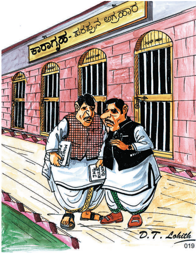
ಆದಷ್ಟು ಬೇಗ ಇದನ್ನು ಏನಿ ಮಾಡಿಸಿ ಬಿಡಬೇಕು. ಯಾವಾಗ ಇಲ್ಲಿಗೆ ಬರಬೇಕಾಗುತ್ತೋ!