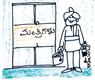
ಊರಲ್ಲಿಲ್ಲ ಸಾರ್.. ದೇವರ ಹತ್ತ ಹೋಗಿದ್ದಾರೆ!