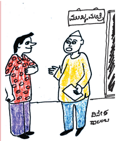
ಭ್ರಷ್ಟಾಚಾರ ಮಾಡಲೇ ಕೂಡದು ಅಂತ ಮುಖ್ಯಮಂತ್ರಿ ತಾಕೀತು ಮಾಡಿದ್ದಾರೆ. ಅದಕ್ಕೆ ರಾಜೀನಾಮೆ ಕೊಡ್ತಿದೀನಿ.