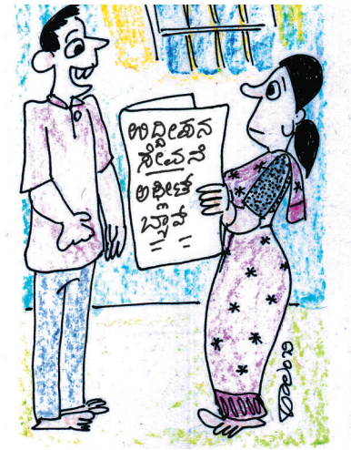
ಕೋಚ್ 'ಬಿ ಪಾಸಿಟಿವ್' ಅಂತ ಹುರಿದುಂಬಿಸಿದ್ದೇ ತಪ್ಪು! ಉದ್ದೇಶನ ಸೇವಿಸಿ ಪಾಸಿಟಿವ್ ಆಗಿ ಬ್ಯಾನ್ ಆದರು ಪಾಪ!