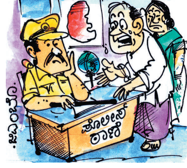
ಮೊಬೈಲ್ ಕರೆನ್ನಿ ಮುಗಿದ ಮೇಲಾದ್ರೂ ಹಣಕ್ಕಾಗಿ ಮನೆಗೆ ಬರಾಳಿ ಅಂದ್ಕೊಂಡೆ.. ಕೊನೆಗೂ ಬರಲೇ ಇಲ್ಲ.. ಸಾರ್!