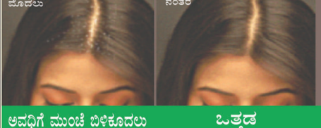
ಮೊದಲು ನಂತರ ಅವಧಿಗೆ ಮುಂಚೆ ಬಿಳಿಕೂದಲು ಒತ್ತಡ