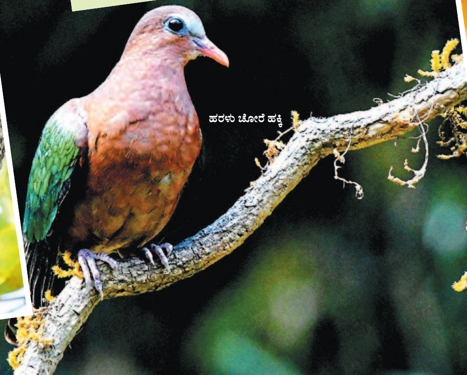
ಹರಳು ಚೋರ ಹಕ್ಕಿ