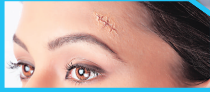
2 ವಾರಗಳು: ಕೆಂಪಾಗುವಿಕೆ/ತುರಿಕೆ ಮಾಯವಾಗುತ್ತದೆ

Doctor-recommended product in USA for scars