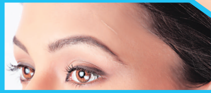
8 ವಾರಗಳು: ಕಣ್ಣಿಗೆ ಕಾಣುವ ರೀತಿಯಲ್ಲಿ ಕಲೆಗಳು ಗುಣವಾಗುತ್ತವೆ