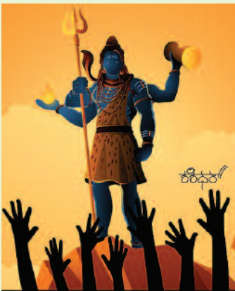
ಏಕಕಾಲದಲ್ಲೇ ಬೇಡುವ ನೂರಾರು ಭಕ್ತರ ಬೇಡಿಕೆ ಸರಬರಾಜು ಮಾಡಲು.