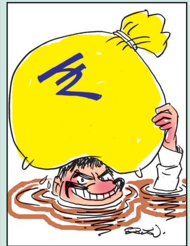
ನೆರೆ ಪರಿಹಾರದಲ್ಲಿ ಹೊರೆ ಹೊರೆಗಳನ್ನು ನುಂಗಿದವರು.