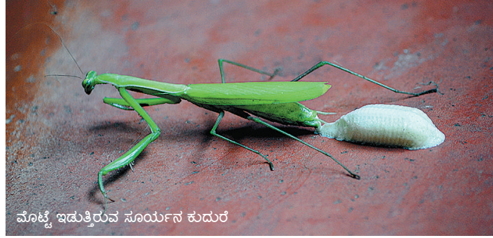
ಮೊಟ್ಟೆ ಇಡುತ್ತಿರುವ ಸೂರ್ಯನ ಕುದುರೆ

ಹೌದು! ಮನೆಯ ಬಳಿಯಿದ್ದ ಆ ಗಿಡದಲ್ಲಿ ತಿಂಗಳ ಹಿಂದೆಯಷ್ಟೇ ಚಿಕ್ಕದಾದ ಗೂಡೊಂದನ್ನು ನೋಡಿದ್ದೆ. ಯಾವುದೋ ಚಿಟ್ಟೆಯ ಗೂಡಾಗಿರಬಹುದು ಅಂದುಕೊಂಡಿದ್ದೆ. ಅವತ್ತು ನೋಡುತ್ತೇನೆ- ನಸು ಹಳದಿ ಬಿಳಿ ಬಣ್ಣದ ಚಿಕ್ಕ ಚಿಕ್ಕ ಸೂರ್ಯನ ಕುದುರೆಗಳು ಅದರಿಂದ ಹೊರಬರುತ್ತಾ ಇವೆ! ಸೂರ್ಯನ ಕುದುರೆ ಅಥವಾ ಪ್ರೇಯಿಂಗ್ ಮ್ಯಾಂಟಿಸ್ ನಮ್ಮ ಪರಿಸರದಲ್ಲಿ ಕಾಣಲು