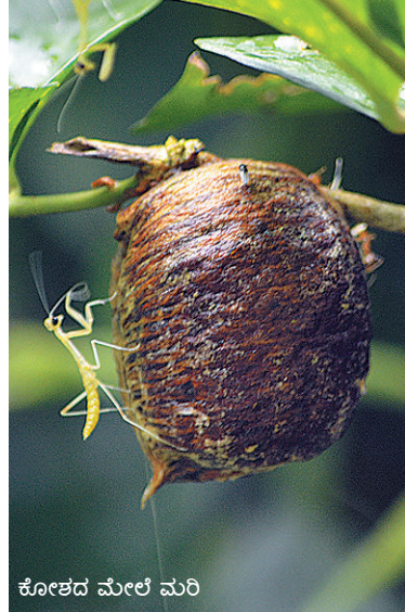
ಕೋಶದ ಮೇಲೆ ಮರಿ