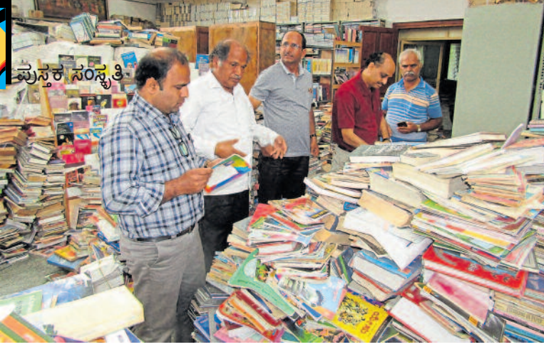
ದೂರದೂರಿನ ಆಸಕ್ತರನ್ನು ಸೆಳೆಯುವ ಪುಸ್ತಕ ಮನೆ

ತಾಂತ್ರಿಕ... ಹೀಗೆ ಯಾವುದುಂಟು, ಯಾವುದಿಲ್ಲ. ಎಲ್ಲಾ ವಿಧದ ಸಾಹಿತ್ಯ ಪ್ರಕಾರಗಳ ಸಂಗ್ರಹಗಳು ಒಂದೂ ಸೂರಿನಡಿ. ಹಿಂದೂ, ಜೈನ, ಇಸ್ಲಾಂ, ಕ್ರೈಸ್ತ ಧರ್ಮಗಳ ಗ್ರಂಥಗಳು. ನಾಲ್ಕು ಸಾವಿರಕ್ಕೂ ಮಿಕ್ಕಿ ಎತ್ತರವಾಗಿವೆ.