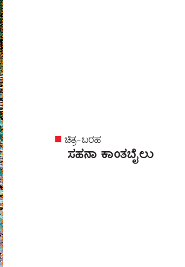
■ ಚಿತ್ರ-ಬರಹ ಸಹನಾ ಕಾಂತಬೈಲು