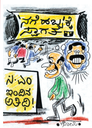
• ಸೋಲಿಸಿ •