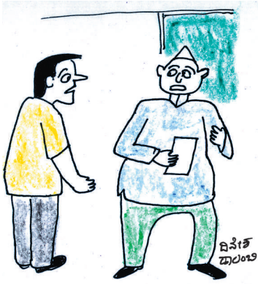
ನೀನು ನನ್ನ ದೊಡ್ಡಕ್ಕನ್ನ ಮಗ ಏನೋ ಸರಿ. ಆದ್ರೆ ಲಂಚ ತಗೊಳ್ಳೆ ನಿನ್ನ ಕೆಲಸ ಮಾಡಿಕೊಟ್ಟೆ ಅದು ಸ್ವಜನ ಪಕ್ಷಪಾತ ಆಗಲ್ಲೇ?