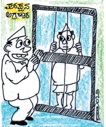
ಇಲ್ಲವ್ಯಾ ಇಲ್ಲ..! ಇನ್ನೂ ಆರೆಸ್ಟ್ ಆಗಿಲ್ಲ! ಇಲ್ಲಿ ಹೇಗಿರುತ್ತೆ ನೋಡೋಣ ಅಂತ ಬಂದೆ!