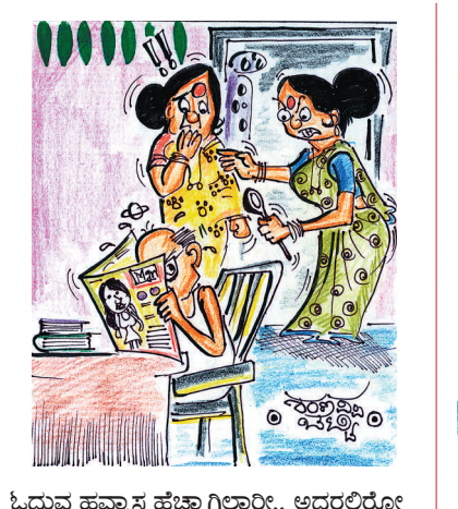
ಓದುವ ಹವ್ಯಾಸ ಹೆಚ್ಚಾಗಿಲ್ಲಾರಿ.. ಅದರಲ್ಲಿರೋ ಸುಂದರ ಹುಡುಗಿಯರ ಫೋಟೋ ನೋಡೋ ಹುಚ್ಚೇ ಹೆಚ್ಚಾಗಿದೆ!