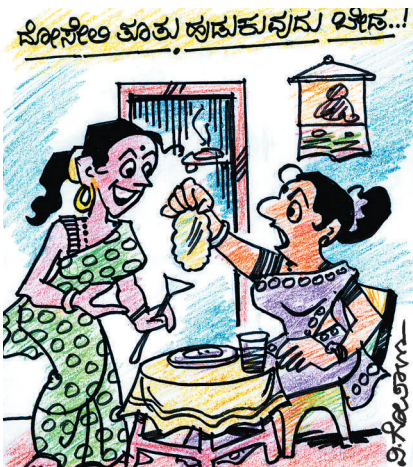
ನೀವು ದೋಸೆಯಲ್ಲಿ ತೂತು ಹುಡುಕುತ್ತೀರಿ ಅಂತ ದೋಸೆ ಮಾಡುವುದನ್ನೇ ನಿಲ್ಲಿಸಿದ್ದೇನೆ.. ಅತ್ತೆ ಇದು ಚಪಾತಿ!