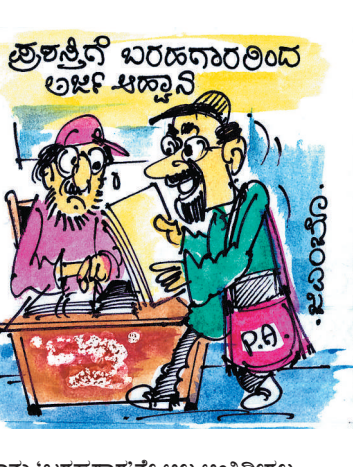
ನಾನು 'ಬರಹಗಾರ'ನೇ ಅಲ್ಲ ಅಂತಿದ್ದೀರಲ್ಲ.. ಎಷ್ಟೊಂದು ಮಂತ್ರಿಗಳಿಗೆ, ಶಾಸಕರಿಗೆ ಎಷ್ಟೊಂದು ಭಾಷಣ ಬರೆದು ಕೊಟ್ಟಿದ್ದೀನಿ ಗೊತ್ತಾ..?