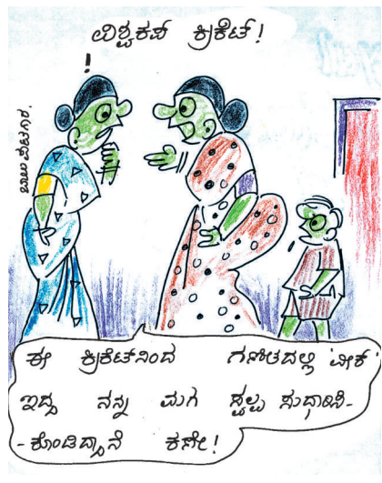
ಈ ಕ್ರಿಕೆಟ್‌ನಿಂದ ಗಣಿತದಲ್ಲ ಚಿಕ್ಕ ಇದ್ದು ನನ್ನ ಮಗ ಸ್ವಲ್ಪ ಸುದಾಣಿ - ಕೊಂಡಿದ್ದಾನೆ ಕಣೀ!