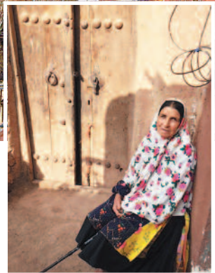
ಅಬ್ಯಾನೆಯ ಹಿರಿ ಜೀವಗಳು

ಬದಿಗಳಲ್ಲಿ ಮಣ್ಣಿನ ಮನೆಗಳನ್ನು ಕಂಡೆವು. ಪ್ರತಿಯೊಂದು ಮನೆಯನ್ನೂ ಸ್ಥಳೀಯವಾಗಿ ಸಿಗುವ ಜೇಡಿಮಣ್ಣು ಹಾಗೂ ಮರದಿಂದ ಪುರಾತನ ಕಾಲದ ವಿನ್ಯಾಸ ಶೈಲಿಯಲ್ಲಿ ಕಟ್ಟಲಾಗಿದೆ. ಮನೆಗಳಿಗೆ ದೊಡ್ಡದಾದ ಮರದ ಹೆಬ್ಬಾಗಿಲುಗಳನ್ನು ಅಳವಡಿಸಿದ್ದು, ಪ್ರತಿಯೊಂದು ಬಾಗಿಲಿನ ಮೇಲೆಯೂ ಎರಡು ಬೇರೆ ಬೇರೆ ವಿನ್ಯಾಸದ ಕಬ್ಬಿಣದ ಬಡಿಯುವ ಗೂಬಟುಗಳಿವೆ. ಗಂಡಸರು ಬಂದಾಗ ಗಂಡಸರಿಗೆ ಮೀಸಲಾದ ಗೂಬಟನ್ನು ಬಡಿಯಬೇಕು. ಹೆಂಗಸರು ತಮಗೆ ಮೀಸಲಾದ ಗೂಬಟನ್ನು ಬಡಿಯಬೇಕು. ಬಡಿಯುವ ಶೈಲಿಯಲ್ಲಿ ತಮ್ಮ ಮನೆಗೆ ಬಂದವರು ಯಾರು ಎಂದು ಒಳಗಿರುವವರು ತಿಳಿಯಬಲ್ಲರಂತೆ.