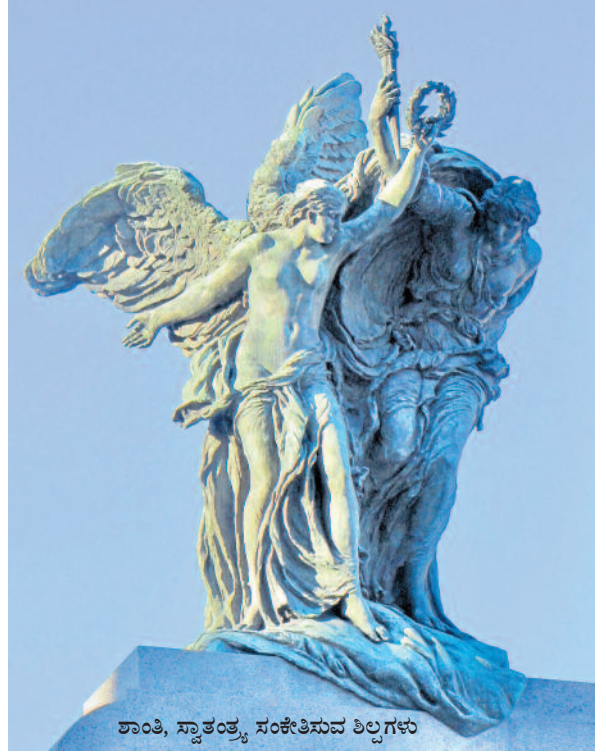
ಶಾಂತಿ, ಸ್ವಾತಂತ್ರ್ಯ ಸಂಕೇತಿಸುವ ಶಿಲ್ಪಗಳು