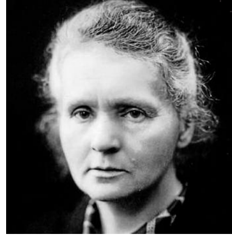
ಎರಡು ಬಾರಿ ನೊಬೆಲ್ ಪಡೆದ ಏಕೈಕ ವ್ಯಕ್ತಿ ಮೇರಿ ಕ್ಯೂರಿ

ಮೇರಿ ಕ್ಯೂರಿ, ಆಕೆಯ ಗಂಡ ಪಿಯರಿ ಕ್ಯೂರಿ, ಮಗಳು ಐರೀನ್, ಅಳಿಯ ಜೋಲಿಯೋಟ್, ಮತ್ತೊಬ್ಬ ಅಳಿಯ ಲಬ್‌ಸಿ - ಎಲ್ಲರೂ ನೊಬೆಲ್ ವಿಜೇತರೇ. ಕುಟುಂಬದ ಐದು ಜನ ನಾಲ್ಕು ಬಹುಮಾನಗಳನ್ನು ಹಂಚಿಕೊಂಡಿದ್ದಾರೆ. 1903ರಲ್ಲಿ ಮೇರಿ ಕ್ಯೂರಿ ಮತ್ತು ಪಿಯರಿ ಕ್ಯೂರಿ ಅವರಿಗೆ ಭೌತಶಾಸ್ತ್ರದ ಬಹುಮಾನ ನೀಡಲಾಯಿತು. ಇದೋ ಕೇಳಿ ಸ್ಮಾರಸ್ಯ. ಬಹುಮಾನಕ್ಕೆ ಹೆಸರುಗಳನ್ನು ಸೂಚಿಸಿದ ಫ್ರೆಂಚ್ ಪಂಡಿತವರೇಣ್ಣರು ಮೇರಿಯ ಹೆಸರನ್ನು ಬೇಕೆಂದೇ ಬಿಟ್ಟಿದ್ದರು. ಕಾರಣ, ಆಕೆ ಹೆಂಗಸು, ಅದೂ ವಿದೇಶದ ಹೆಂಗಸು! (ಮೇರಿ ಹುಟ್ಟಿ ಬೆಳೆದದ್ದು ಪೋಲೆಂಡಿನಲ್ಲಿ). ಈ ಹುನ್ನಾರವನ್ನು ಹೇಗೋ ಅರಿತ ಪಿಯರಿ, ನೊಬೆಲ್ ಸಂಸ್ಥೆಗೆ ಪತ್ರ ಬರೆದು, 'ಬಹುಮಾನ ಕೊಡುವುದಾದರೆ ಇಬ್ಬರಿಗೂ ಕೊಡಿ. ನನಗೆ ಮಾತ್ರ ನೀಡಿದರೆ ನಾನು ಸ್ವೀಕರಿಸುವುದಿಲ್ಲ'