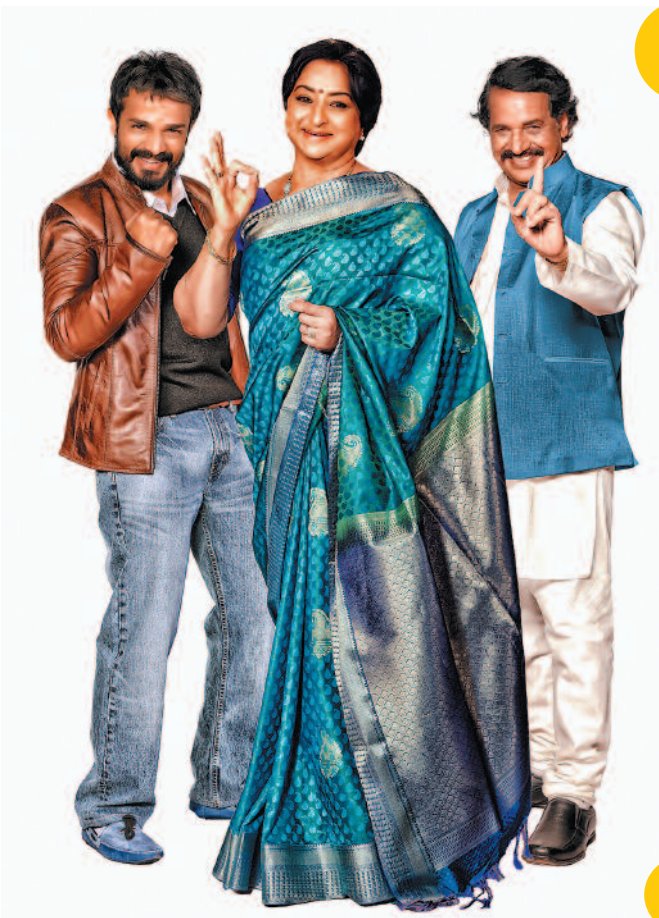
ಝೀ ಕನ್ನಡದ ಡ್ರಾಮಾ ಜ್ಯೂನಿಯರ್ಸ್‌ನಲ್ಲಿ ವಿಜಯ್ ರಾಘವೇಂದ್ರ, ಹಿರಿಯ ನಟ ಲಕ್ಷ್ಮಿ ಹಾಗೂ ಟಿ.ಎನ್.ಸಿತಾರಾಮ್

ಚಿತ್ರಕಥೆಯ ಸಿನಿಮಾಗಳನ್ನು ಕಡಿಮೆ ಬಜೆಟ್‌ನಲ್ಲಿ ಮಾಡುವ ಪ್ರಯತ್ನಗಳನ್ನು ನಿರ್ಮಾಪಕರು ಪ್ರೋತ್ಸಾಹಿಸಿದರೆ ಚಿತ್ರೋದ್ಯಮಕ್ಕೆ ಒಳ್ಳೆಯದಾಗುತ್ತದೆ ಎನ್ನುವ ಅಭಿಪ್ರಾಯ ಜನರದ್ದು.